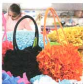
Fuxico das mulheres de Americanópolis (zona sul)