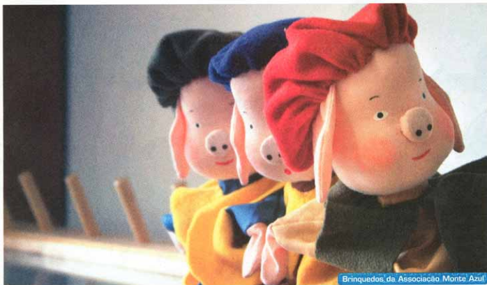
Brinquedos, da Associação Monte Azul