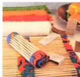
Jogo americano de palitos japoneses da Mundaréu