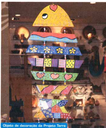
Objeto de decoração da Projeto Terra

"Selecionamos os projetos que serão apoiados levando em conta a forma como a comunidade trabalha a matéria-prima: se respeita o meio ambiente, se não existe exploração do trabalho e se remunera de forma adequada os artesãos", ex-